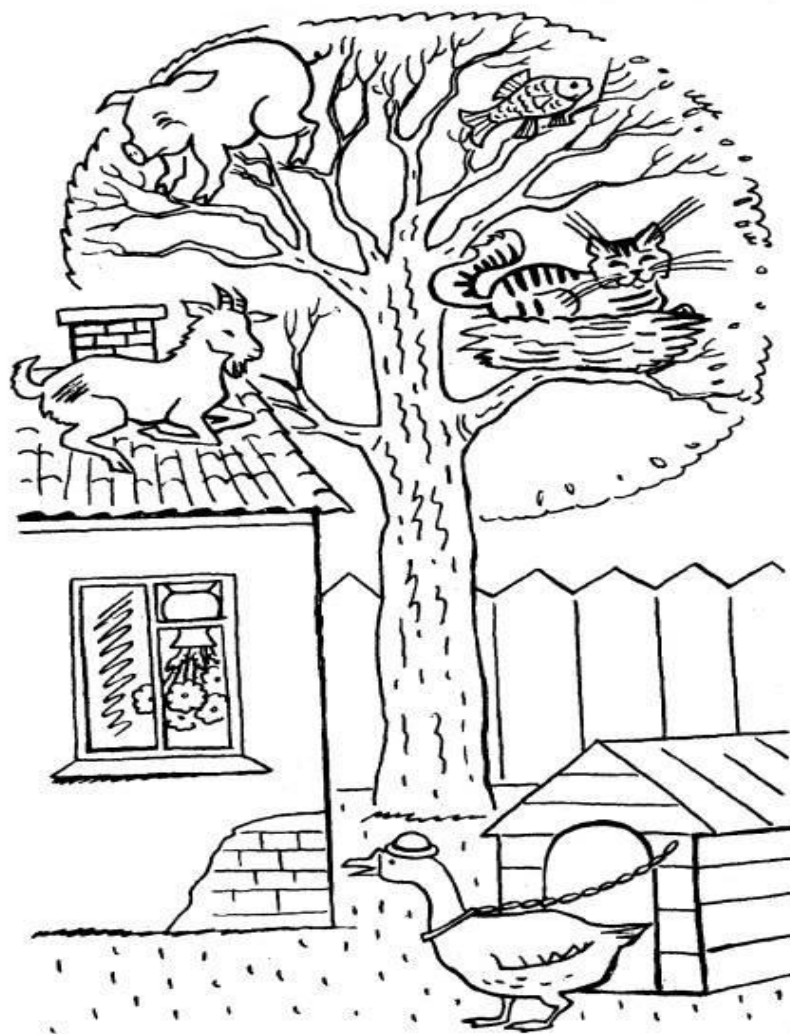
Рисунок к методике «Нелепицы»

«Внимательно посмотри на эту картинку и скажи, все ли здесь находится на своем месте и правильно нарисовано. Если что-нибудь тебе покажется не так, не на месте или неправильно нарисовано, то укажи на это и объясни, почему это не так. Далее ты должен будешь сказать, как на самом деле должно быть».